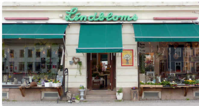
Frilagda bokstäver och symboler fungerar bra i de flesta sammanhang. En verksamhets utbredning kan visas med en tunn lysande linje i till exempel neon.