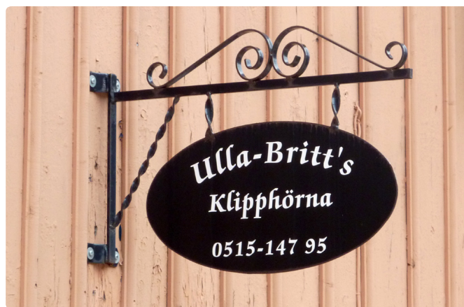
Ett vackert exempel på en konsolmonterad pendelskylt, som smälter in i äldre bebyggelsemiljöer.