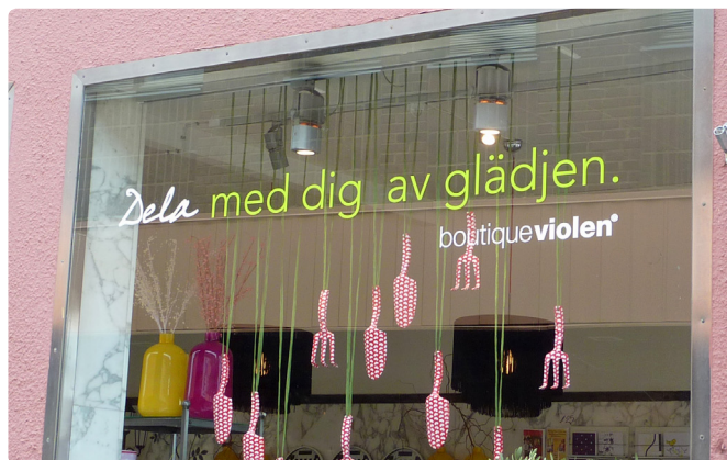
Skyltning av verksamheten via dess fönster ger en positiv stadsbild där byggnadens fasad i högre grad kan upplevas av den förbipasserande.

Onödig upprepning av budskap förbättrar inte skyltningens genomslagskraft.