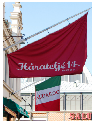
Flaggor med produkt- och verksamhetsnamn kräver bygglov.