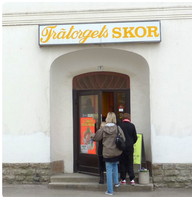
Skytlådor ger oftast ett klumpigt intryck och är svåra att anpassa till en byggnads arkitektur. Val av kulör, lådans djup och textens utformning påverkar dock helhetsintrycket.

Verksamhetsskytlar som monteras på fasad med information om verksamhet, till exempel läkare, tandläkare med flera tillåts utan krav på bygglov om den utförs med maximala mått 15x25 centimeter. Skylten ska vara av polerat rostfritt stål med svart text och monteras i anslutning till entrén.