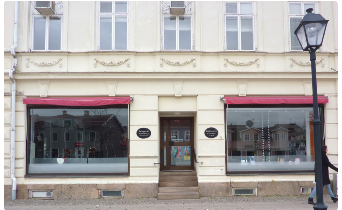
Ett fint exempel där verksamheten helt underordnat sig byggnadens förutsättningar. De uppfällbara markiserna ramar in verksamheten.

Dessa skyltar får ej förekomma enligt detta program då de förändrar intrycket av fasaden och bidrar till en annan skala än vad den småskaliga stadens byggnation tillåter.