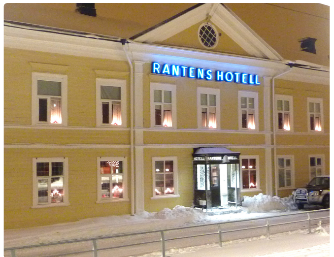
En traditionell neonskylt utgör nattetid ett bra exempel på skyltbelysning.

Neonskyltar kan i rätt utförande vara ett bra alternativ till belysning när en skylt skall uppfattas på håll.