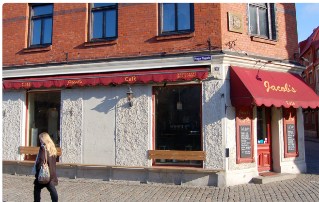
Uppfällbar markis (längs långsidan) och fastmonterad markis (på hörnet). Fastmonterade markiser kräver bygglov.