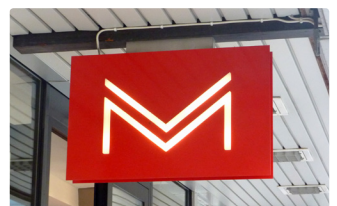
En dubbelsidig skylt där invändigt monterad belysning ger en bra kontrast mellan budskap och bakgrundsskylt.