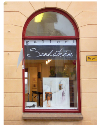
Genom att använda skyltfönstret påverkas inte byggnadens grundelement. Båda exemplen ovan har gjorts med god genomsiktighet.